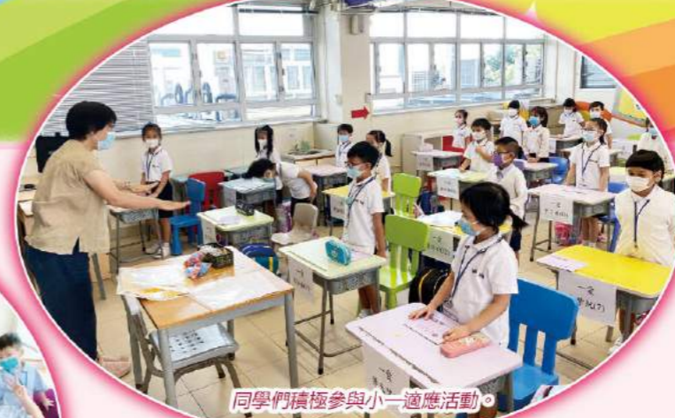
同學們積極參與小一適應活動。