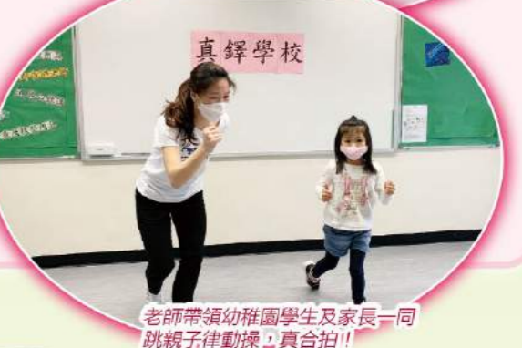
老師帶領幼稚園學生及家長一同跳親子律動操，真合拍！！