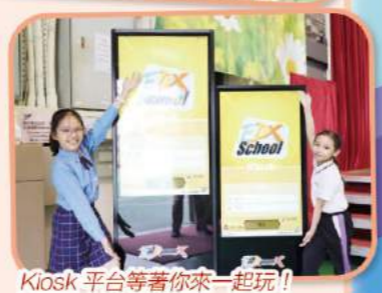
Kiosk 平台等著你來一起玩！