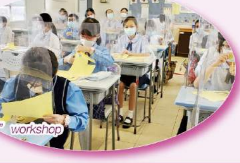
English Day activities