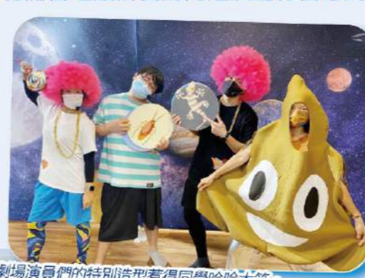
劇場演員們的特別造型惹得同學哈哈大笑。