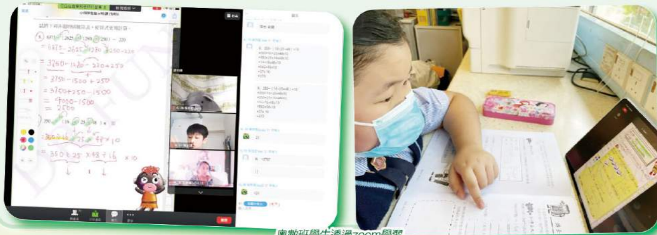
奧數班學生透過zoom學習

為發掘學生的數學潛能和提升其數學思維，本校數學組為四、五年級組織數學資優小組，由校外導師為學生進行奧數培訓，透過不同的學習主題及教學活動，激發學生對數學的興趣，加強他們對數學知識的運用，提升解難能力及邏輯思維能力。