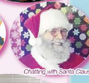
Chatting with Santa Claus