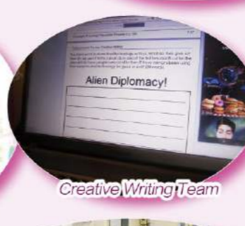
Creative Writing Team