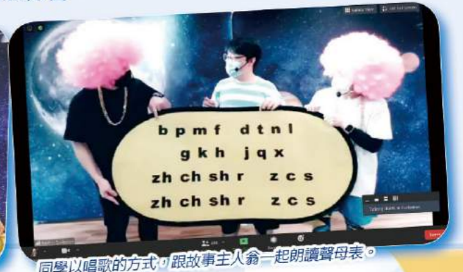
同學以唱歌的方式，跟故事主人翁一起朗讀聲母表。