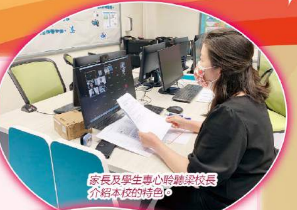
家長及學生專心聆聽梁校長介紹本校的特色。