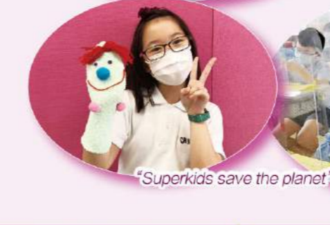
'Superkids save the planet' workshop