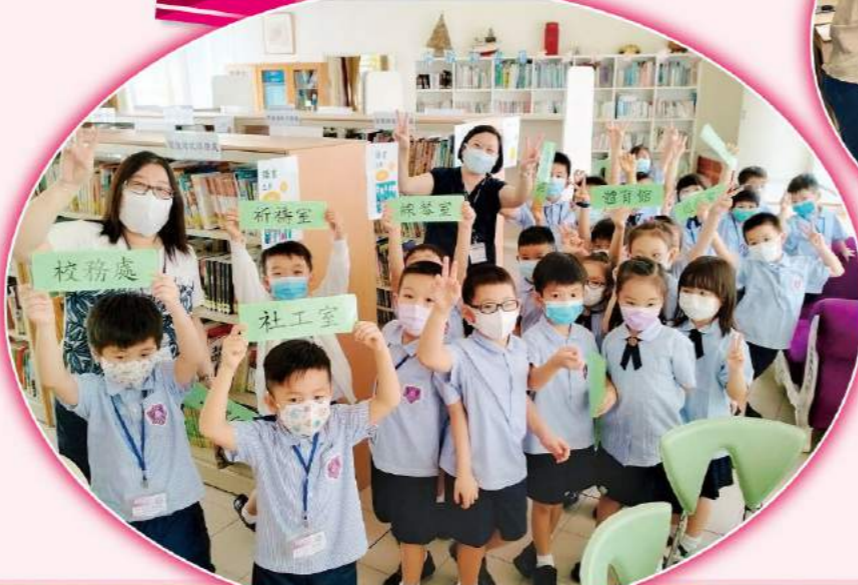
參觀校園時，小一新生都獲得準確導引。

本年度我校舉行了一系列小一適應活動，希望小一新生儘快適應及融入真鐸大家庭。今年小一適應日分別以 ZOOM 網上實時互動及實體課形式進行，讓小一新生與班主任及科任老師彼此認識，並了解日常課堂運作。本校也特為將入讀小一的學生舉辦網上優才班，藉此發展其多元智能。此外，透過校園參觀及幼稚園親子 ZOOM 活動，加深了家長及學生對本校的認識。