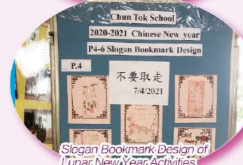
Slogan Bookmark Design of Lunar New Year Activities