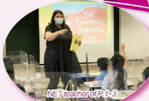
NET teacher of P.1-3

Gifted students are recruited to the 'Creative Writing Team' where their writings are collected for the School Newsletter and will be published in June. Before Christmas we had a special zoom activity, 'Chatting with Santa Claus' for P3 students. We Joined the 'Superkids Save the Planet' workshop provided by the Language Lab, where students were engaged in a storytelling activity using puppets.