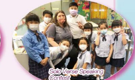
Solo Verse Speaking Contest