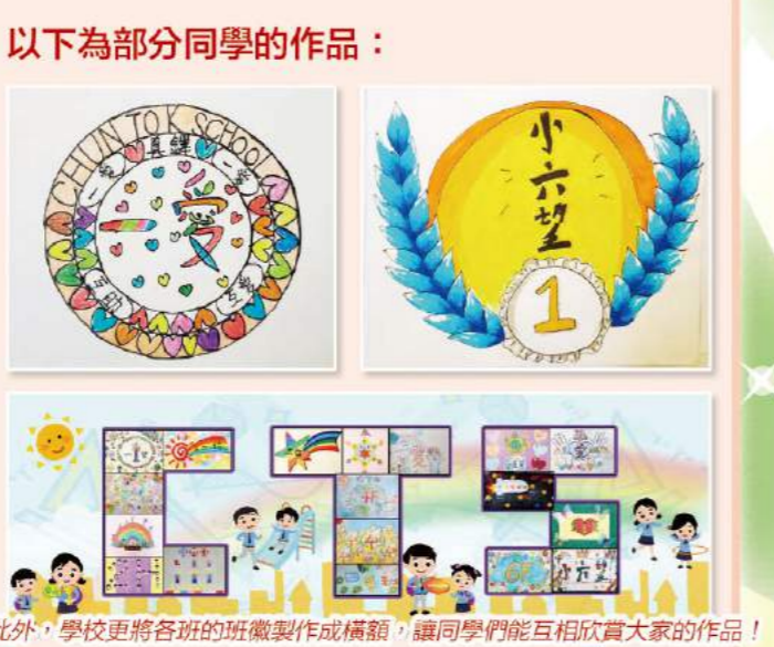
此外，學校更將各班的班徽製作成橫額，讓同學們能互相欣賞大家的作品！