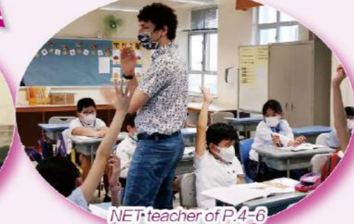
NET teacher of P.4-6